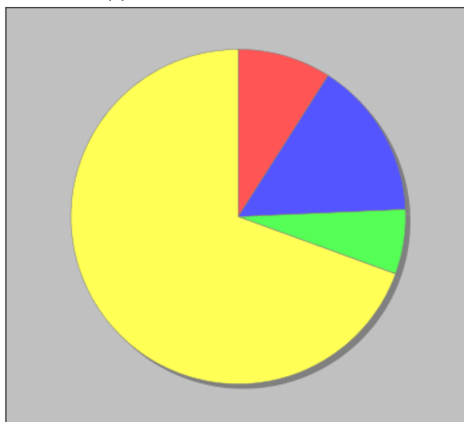
Distribuzione dei docenti a T.I. per anzianità nel ruolo di appartenenza (riferita all'ultimo ruolo)